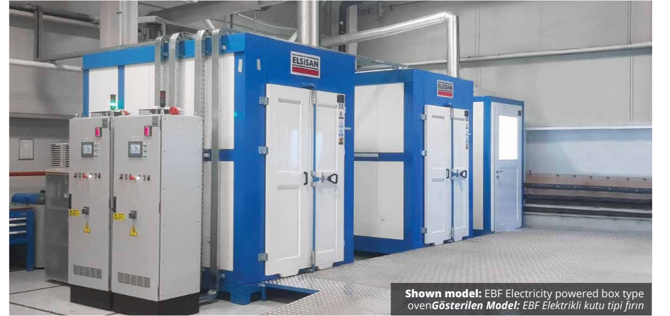
Shown model: EBF Electricity powered box type oven Gösterilen Model: EBF Elektrikli kutu tipi fırın