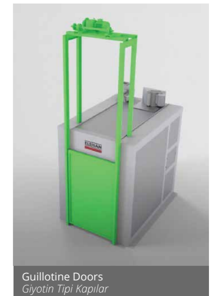
Guillotine Doors Giyotin Tipi Kapılar