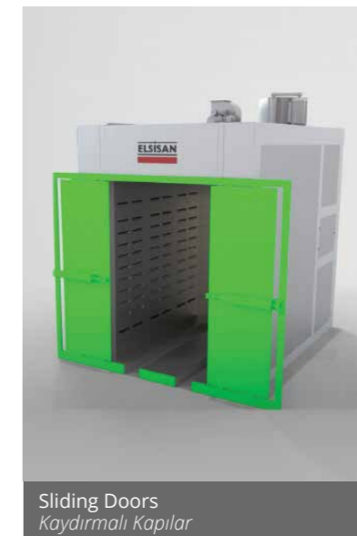
Sliding Doors Kaydırmalı Kapılar