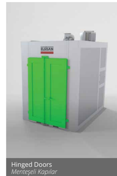
Hinged Doors Menteşeli Kapılar