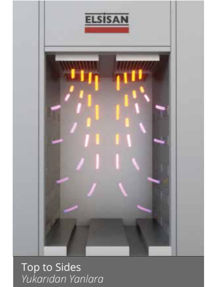
Top to Sides Yukarıdan Yanlara