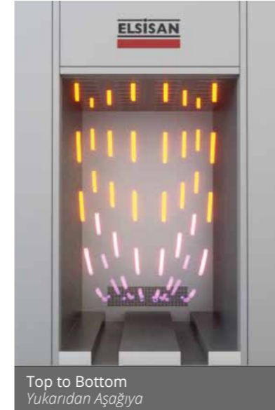
Top to Bottom Yukarıdan Aşağıya

Kutu fırınlarımız, işlem verimliliğinizi artırmak için çeşitli hava akışı seçenekleri sunar. Belirli ihtiyaçlarınıza uygun olarak, optimal performans sağlanacak size özel çözümler geliştirilebilir. Tasarımlarımız malzemelerinizin ve uygulamalarınızın benzersiz gereksinimlerini karşılayacak şekilde kontrollü ve eşitlik ısı dağılımı sağlar.